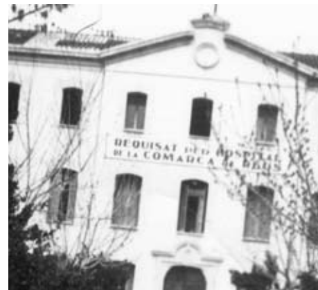
Façana de l'HSC. Sobre la teulada es veu un extrem de la creu que s'hi va pintar

Alguns d'aquests documents els podeu veure, fins al 15 de novembre, a l'exposició L'Hospital de Sang de Cambrils als documents .