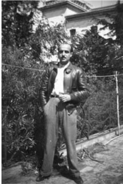
Un dels metges de l'Hospital de Sang de Cambrils

S'han utilitzat documents privats que pertanyen a diferents famílies cambrilenques i que fan referència a l'HSC.