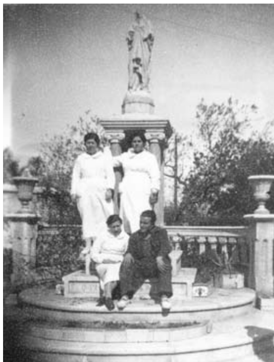
Tres infermeres i un pacient al jardí de l'Hospital de Sang de Cambrils.

Informació: Àrea de Cultura de l'Ajuntament de Cambrils (Tel. 977 368484, clt@cambrils.cat ).