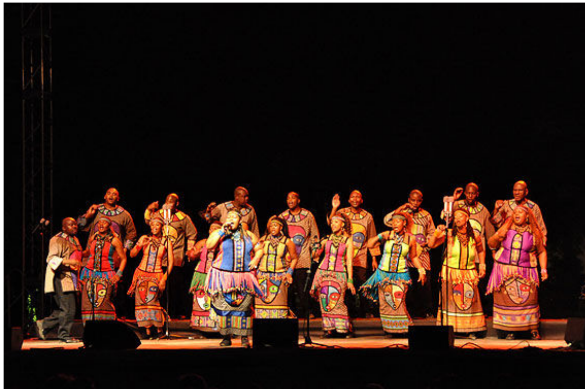
La música dels Soweto Gospel Choir està arrelada a la música sud-africana

final del concert van apareixen els temes més coneguts i de ben segur molt esperats. El públic també es convertí en còmplice de l'engrescament desenfrenat picant de mans al ritme que indicaren els Soweto Gospel Choir. D'entre aquestes darreres cançons destaquen "I've got a hope", "This little light of mine" i per donar el toc gospel final el concert va concloure amb "Oh happy day!". Finalment acabaren interpretant un darrer bis curtet degut a la insistència d'un públic que restava meravellat i insaciable.