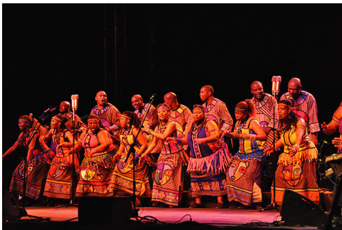
Un moment de l'actuació dels Soweto Gospel Choir, el dissabte al Parc Samà

El passat dissabte era Soweto Gospel Choir l'encarregat d'omplir de música els Jardins del Parc Samà. Les potentíssimes veus dels cantaires combinades amb les seves danses animades entregant tot el cos, van ser tota una delícia sensitiva pel nombrós públic assistent. Soweto Gospel Choir compren els millors talents de moltes esglésies i comunitats de Soweto. La trajectòria internacional de la formació és realment impressionant. Foren partíceps de la banda sonora de la pel·lícula d'animació Wall-E i la cançó Down to Earth, per la qual se'ls concedí un Grammy. Tanmateix ja n'havien aconseguit un altre pel seu disc Blessed. També van tenir l'ocasió d'actuar a la cerimònia de lliurement dels Òscar ja que aquest mateix tema va ser nominat per l'Acadèmia. Han col·laborat amb grans celebritats internacionals com Bono, Robert Plant, Diana Ross o Celine Dion.