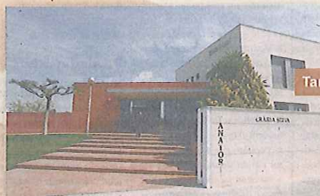
Tanatori del Vendrell

Sales de vetlla i tota classe de serveis funeraris