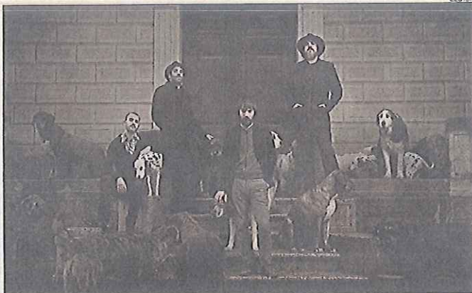
Els barcelonins Standstill són els caps de cartell de la dotzena edició del Festival de l'AMT.