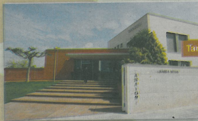
Tanatori del Vendrell

Sales de vetlla i tota classe de serveis funeraris