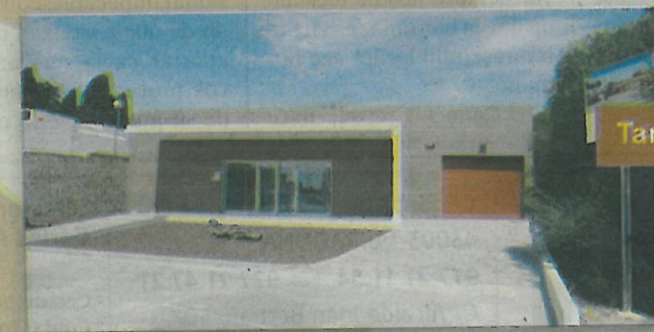
Tanatori de Creixell

Av. Torrent del Lluç, 2 43700 El Vendrell