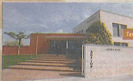
Tanatori del Vendrell

Sales de vetlla i tota classe de serveis funeraris