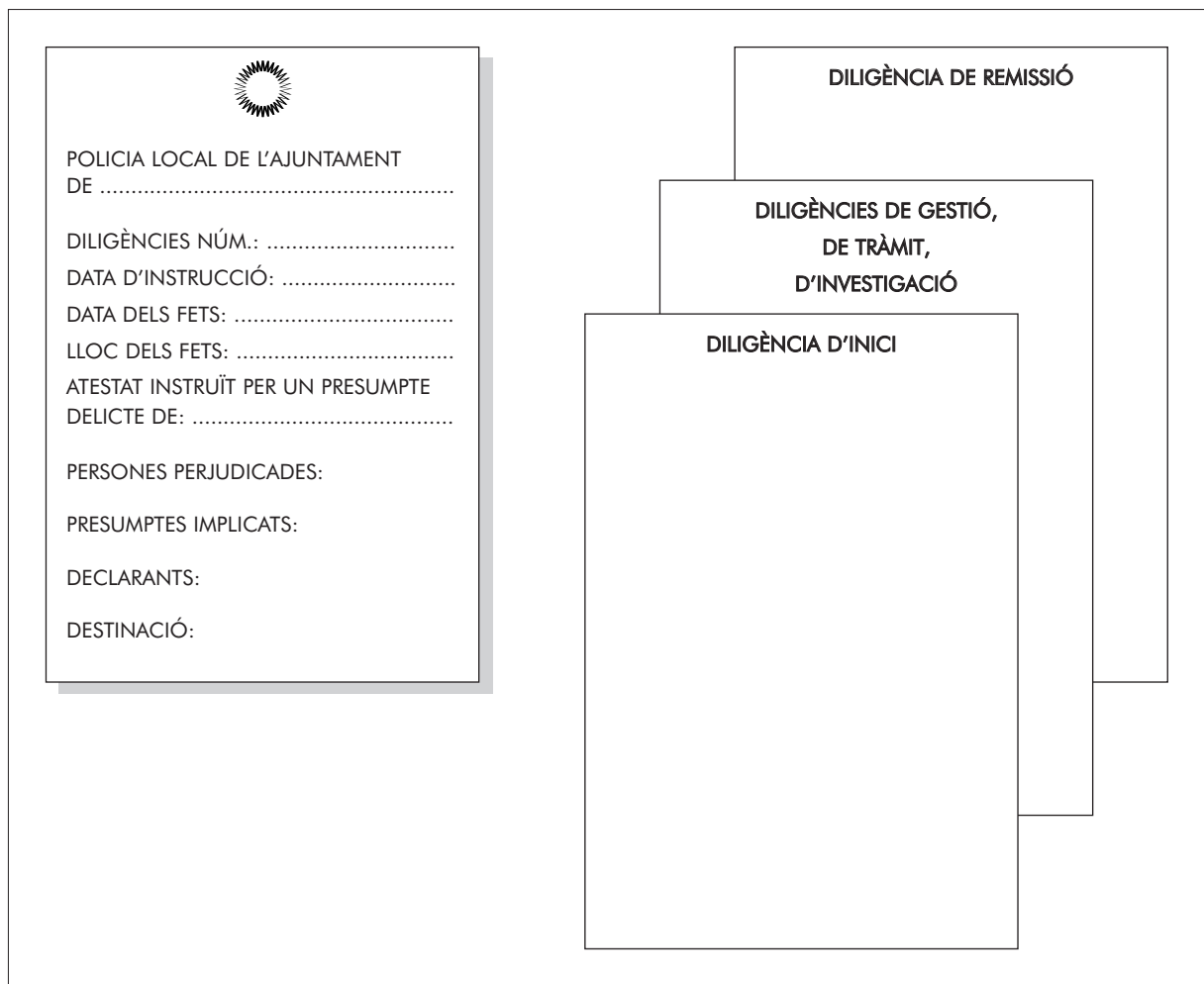
Figura 1. Caràtula de l'atestat. Ordre de les diligències.